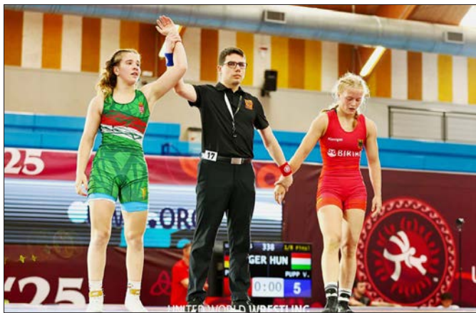
A cikk szerzője:

Viktória, 65 kg-ban 18 évesen, első éves U20-asként vette fel a versenyt a tapasztaltabb és idősebb ellenfelekkel. Nagyon jól kezdte a versenyt, az első két mérkőzésén legyőzte lengyel és német ellenfeleit, akiktől az idén a felkészülési nemzetközi versenyeken vereséget szenvedett. A döntőbe jutásért már nem bírt a török ellenfelével, végül a bronzéremért léphetett szőnyegre. Az éremmérkőzésen a svéd birkózó jóval erősebbnek bizonyult nála, Viktória végül két győztes és két vesztes mérkőzéssel a pontszerző 5. helyen végzett.