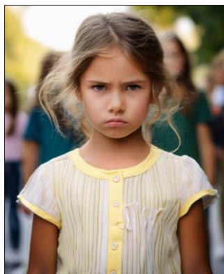
Képünk illusztráció (AI)

Ne harcoljunk mindenben: Válogassuk meg, miért érdemes „csatát vívni”, és mi az, ami belefér.