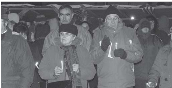
Fotónk az adventi gyertyagyújtás és a falukarácsony meghiitt hangulatát idézi... (Összefoglaló a 12. oldalon)

Folyjon az esztendő kívánt békességben, kívánom, boldogan múltjon, menjen végben. Maradjon meg édes hazánk csendességben, Mindenkire áldás szálljon nagy bőségben! (népköltés)