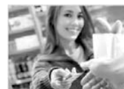
Szabad felhasználásra, hitelkiváltásra