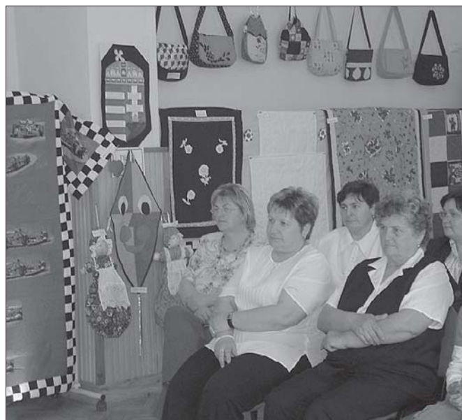
A foltvarrók kiállítása sokakat érdekelt