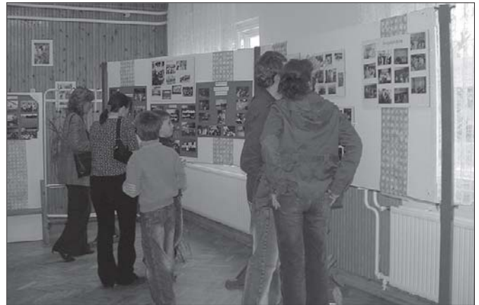
„Mezőfalva élete képekben” kiállítás nyílt nagy sikerrel

„Az én falum Mezőfalva” helyismereti vetélkedővel, a foltvarró kör kreatív foglalkozásával, valamint tájházi látogatással zárult az egyhetes programsorozat. (Rendezvényeken készül további képek a 6. oldalon található.)