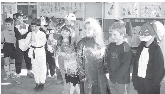
Az iskolai farsang nagy élmény volt a gyerekeknek