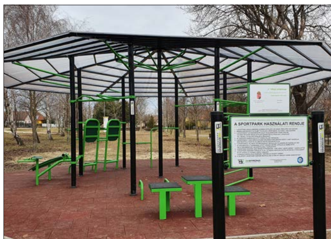
A C-típusú kondipark a felnőttek kikapcsolódását szolgálja