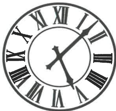
Schneider-számlop, fekete-fehér, lándzsás mutatókkal, perckör nélkül